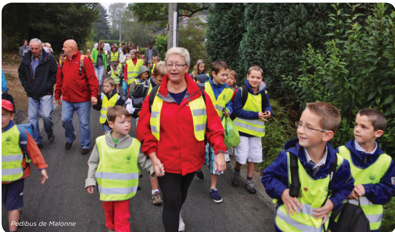
Pedibus de Malonne